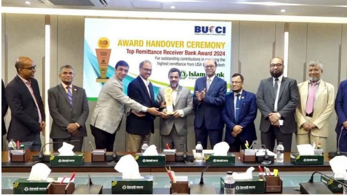
ইসলামী ব্যাংক বাংলাদেশ পিএলসি অ্যাওয়ার্ড গ্রহণের সময়

যুক্তরাষ্ট্রের নিউইয়র্কে আয়োজিত বাংলাদেশ রেমিট্যান্স ফেয়ার ২০২৪-এ “টপ রেমিট্যান্স রিসিভার ব্যাংক অ্যাওয়ার্ড ২০২৪ লাভ করেছে ইসলামী ব্যাংক বাংলাদেশ পিএলসি। ব্যাংকটি মার্কিন যুক্তরাষ্ট্র থেকে সর্বোচ্চ রেমিট্যান্স সংগ্রহের মাধ্যমে বাংলাদেশের বৈদেশিক মুদ্রার রিজার্ভ বৃদ্ধিতে অসামান্য অবদান রাখায় এ সম্মাননা অর্জন করে।