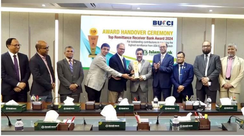
সর্বোচ্চ রেমিট্যান্স গ্রহীতার স্বীকৃতির ফ্রেস্ট হস্তান্তর অনুষ্ঠান।

সর্বোচ্চ রেমিট্যান্স গ্রহীতার স্বীকৃতি পেয়েছে ইসলামী ব্যাংক বাংলাদেশ পিএলসি। সম্প্রতি যুক্তরাষ্ট্রের নিউইয়র্কে আয়োজিত বাংলাদেশ রেমিট্যান্স ফেয়ারে ঘোষিত 'টপ রেমিট্যান্স রিসিভার ব্যাংক অ্যাওয়ার্ড ২০২৪' পুরস্কার পেয়েছে ব্যাংকটি।